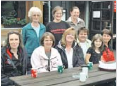
Diesmal waren die Mütter entspannt. Die Meisterschaft hatten ihre Jungs aus der U16 schon vor dem letzten Spiel sicher.