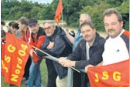
Die Anhänger sind ziemlich gut ausgestattet. Kein Wunder, schließlich leistet sich der Klub eine Fanartikel-Beauftragte.